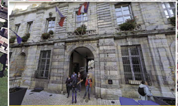
La mairie de Poligny, parcelle de 1373 m2, sur trois niveaux côté Grande Rue. Elle se trouve en partie désaffectée après le déménagement des services de la mairie rue du Champ de Foire. Quel devenir ?