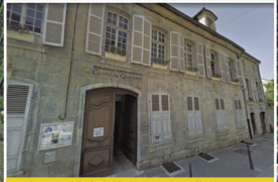
Le bâtiment de la bibliothèque, parcelle de 546 m2, appartient à la ville de Poligny. Quel avenir après le déménagement de la bibliothèque à l'ancienne école maternelle ?