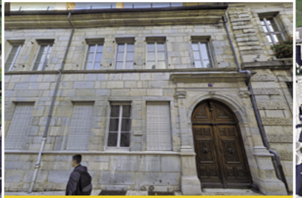
Le bâtiment dit «Ruty», parcelle de 1000 m2, appartient à la ville de Poligny. Il est en partie vide. Jouxant la mairie, il aurait pu permettre à celle-ci, moyennant quelques travaux, de rester au centre ville.

La municipalité a fait le choix de vider le centre ville de Poligny. Des bâtiments historiques appartenant à la ville sont laissés de côté ou en passe de l'être. Tous souffrent d'un manque d'entretien. Cette démarche est contraire aux nécessaires économies de ressources et participe aux difficultés du centre ville alors que, encore, des commerces ferment.