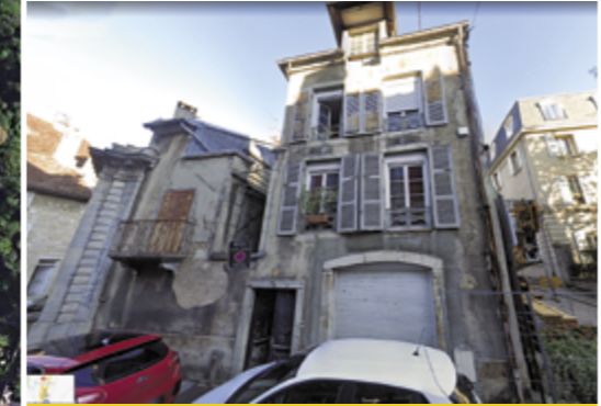
Maison rue Friant appartenant à la ville de Poligny. Elle est en piteux état (2 logements), 176 m2. Quel devenir alors qu'une fontaine classée monument historique lui est adossée ?