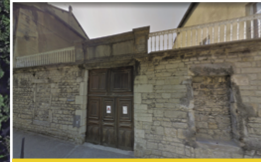
Annexe du Lycée Friant dite «annexe Bonnotte». La ville de Poligny va récupérer ce bâtiment, 861 m2, après les travaux aux Oratoriens. Quel devenir ?